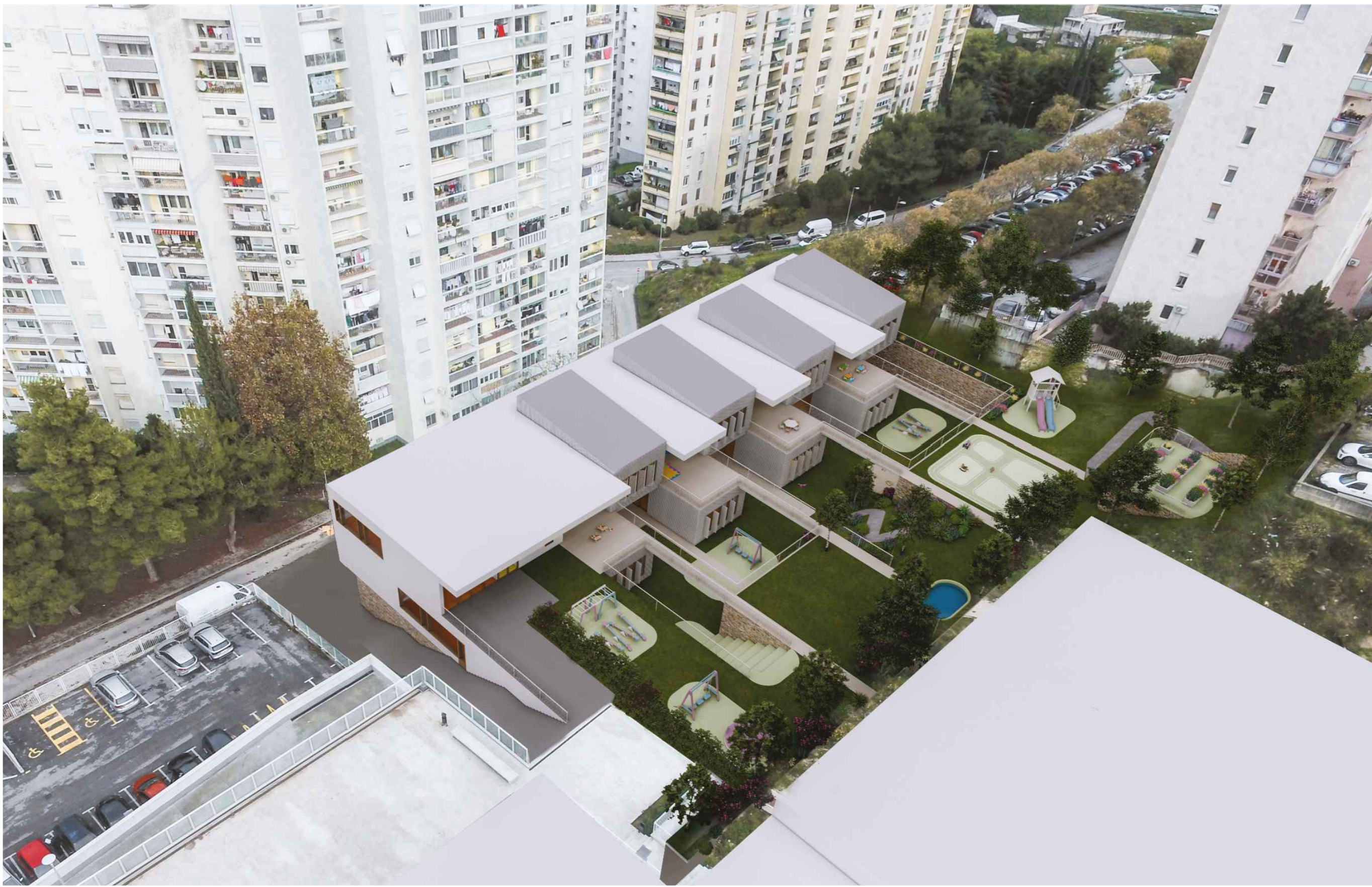
PRIKAZ EKSTERIJERA - iz zračne perspektive