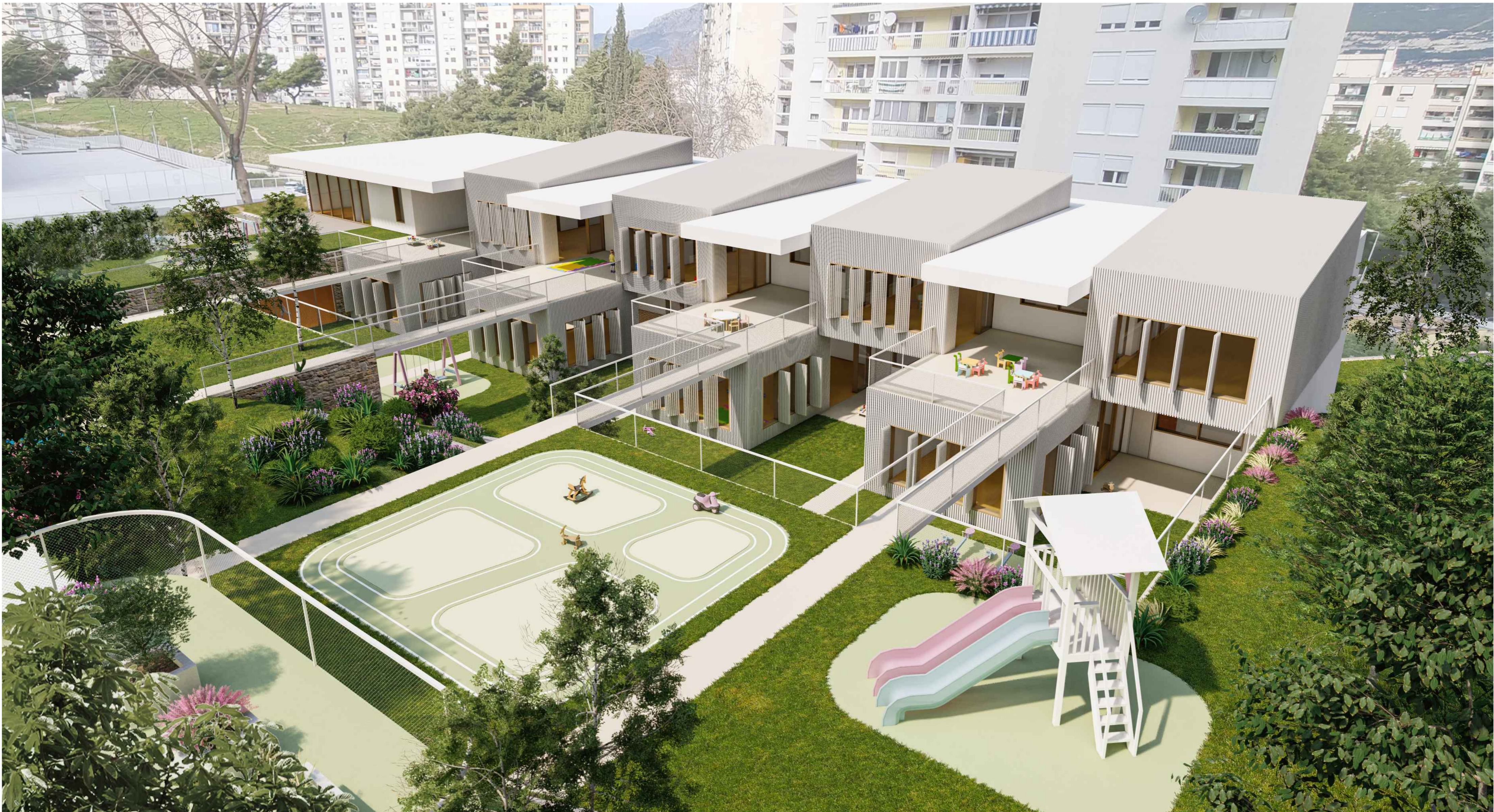
PRIKAZ EKSTERIJERA - iz zračne perspektive