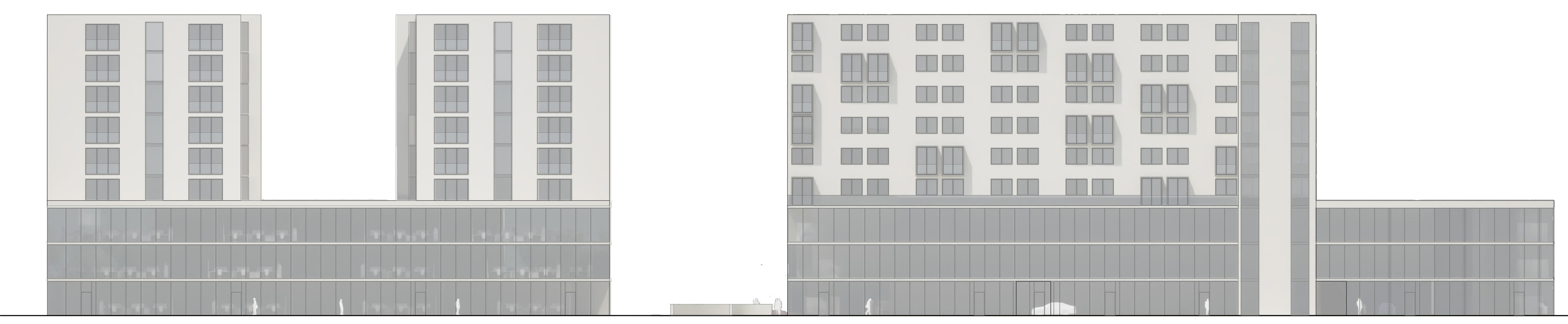
Zapadno pročelje m1:200