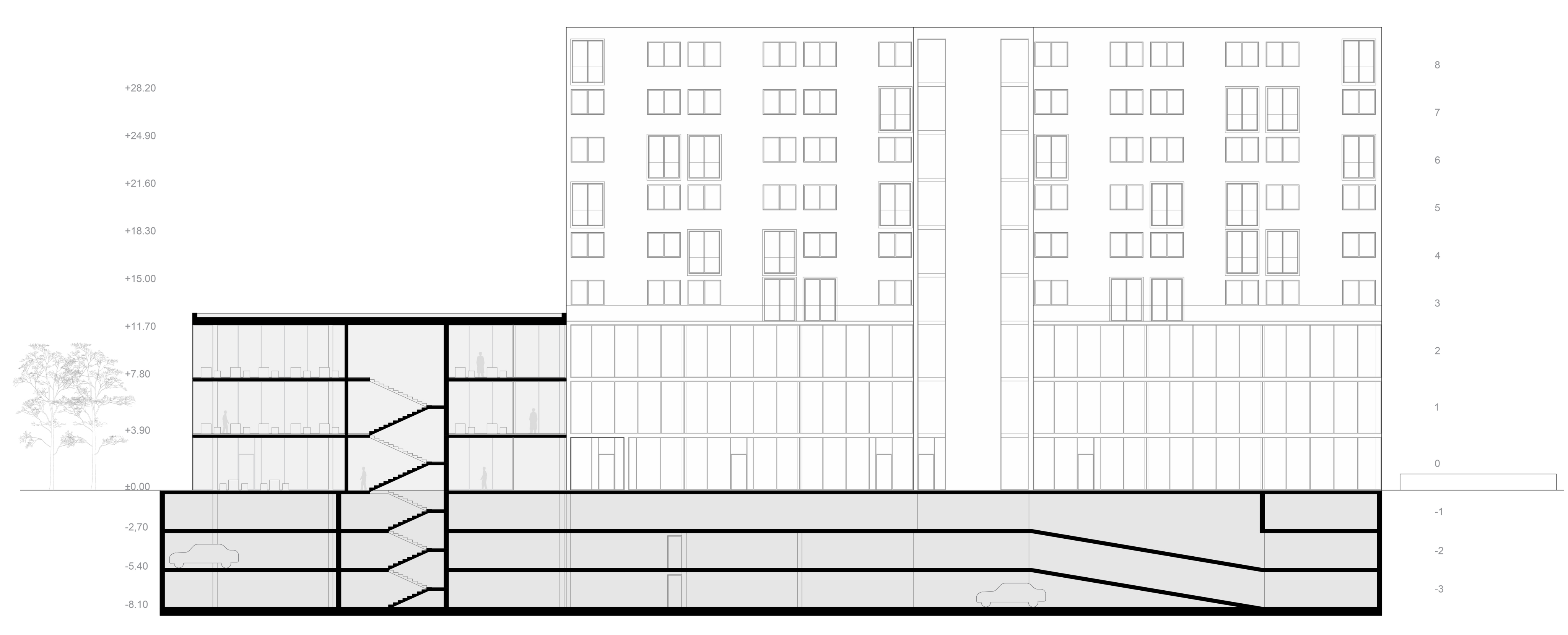
Presjek B-B m1:200