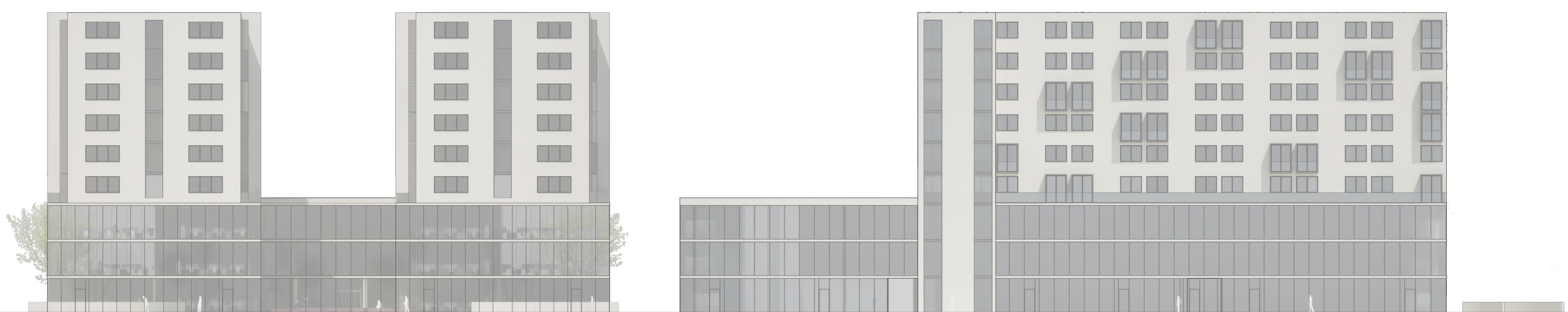
Istočno pročelje m1:200